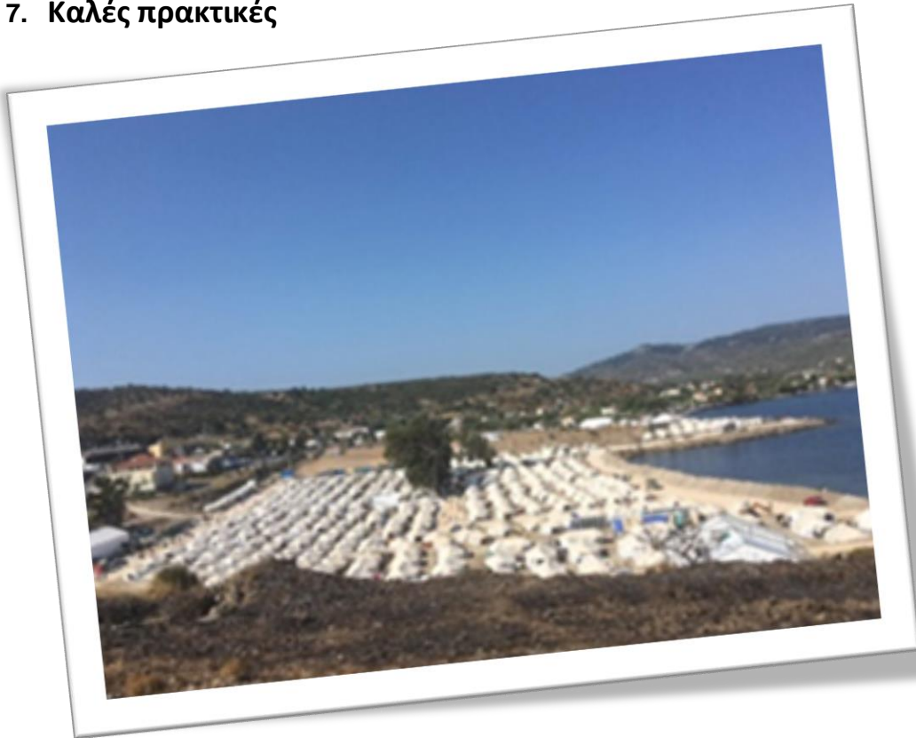
Εικόνα: Κέντρο Υποδοχής και Ταυτοποίησης Λέσβου (Καράτεπε)